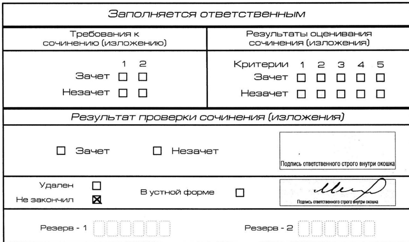
Рис. 10. Заполнение полей нижней части бланка регистрации (участник не закончил написание сочинения (изложения) по уважительным причинам)